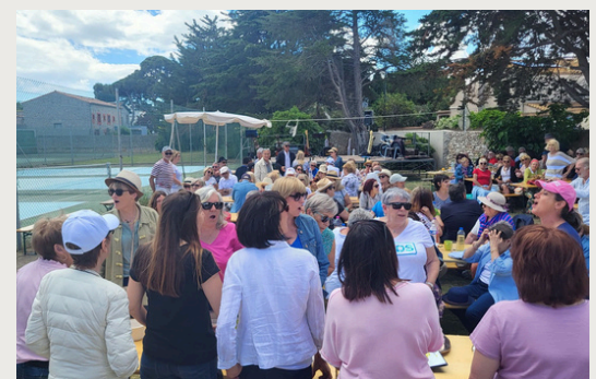
Participation des peintres de l'association avec l'art prend le large